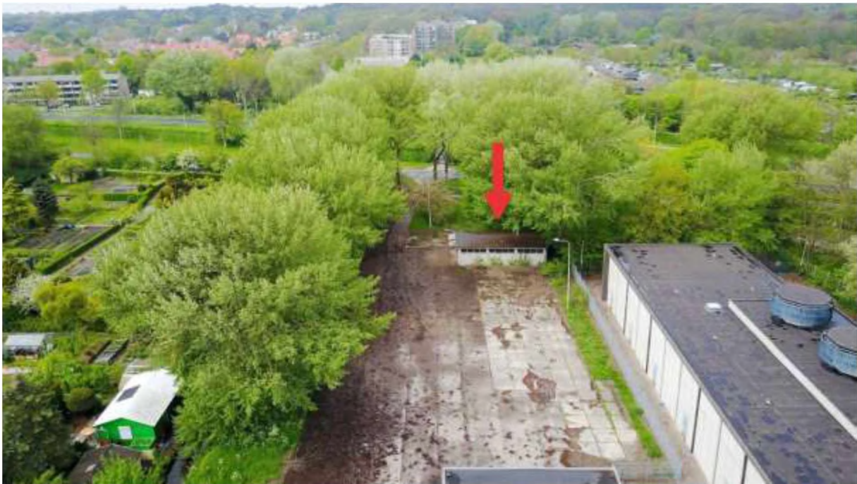
Perceel Westelijke Randweg 1 gezien vanuit het oosten. Het illegale bouwwerk wordt aangegeven met een rode pijl.