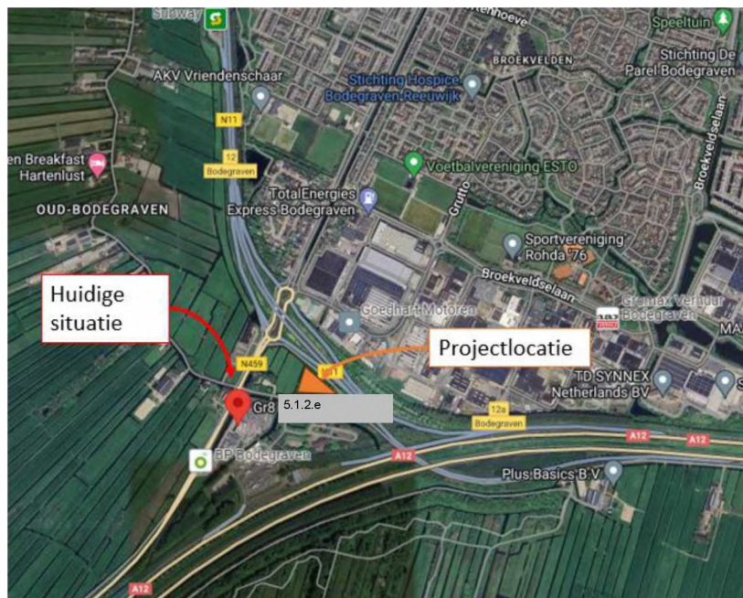
Figuur 1 Kaartweergave Bodegraven incl. huidige opvanglocatie en de projectlocatie

In de memo is in paragraaf 2 de huidige situatie en de potentiële toekomstige ontwikkellocatie (projectlocatie) omschreven. In onderstaand figuur (figuur 1) is de huidige situatie en de projectlocatie geprojecteerd op de kaart. In paragraaf 3 is het interne besluitvormingsproces i.r.t. deze specifieke ontwikkeling beschreven. In paragraaf 4 wordt ingegaan op de businesscase en in paragraaf 5 worden de mogelijke toepassingsmogelijkheden m.b.t. de rechtmatigheid toegelicht.