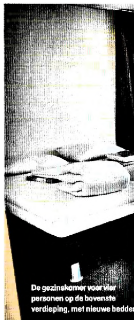
De gezinskamer voor vier personen op de bovenste verdieping, met nieuwe bedden

Vluchtelingen uit Oekraïne zijn geen asielzoekers en hebben meer rechten