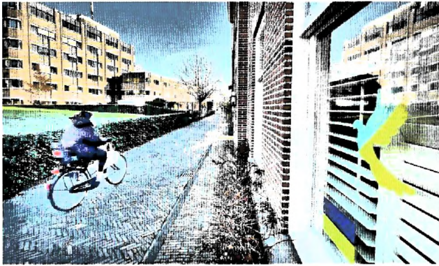
De Oekraïense kleuren op het raam van de overburen: een Kazachstaans gezin