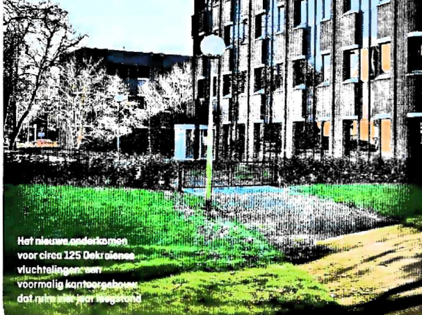
Het nieuwe onderkomen voor circa 125 Oekraïense vluchtelingen aan voormalig kantoorgebouw dat ruim twee jaar leegstand

Het oersaaië gebouw uit de jaren tachtig van de vorige eeuw oogt als een voormalig FBI-kantoor uit een spannende Netflix-serie. Aan de zij- en achterkant ligt een vlekkeloos onderhouden groen grasveld boven de ruime parkeergarage. Op een steenworp afstand staan aan de Hazepaterslaan drie flats met 88 luxe ap-