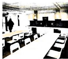
De dubbele keuken is gemeenschappelijk

daad staan weten in de weg en praktische bezwaren. Los van alle wet- en regelgeving op het gebied van onder andere bestemming, bouwvoorschriften, brandveiligheid, tekenen omwonen maar al te vaak bezwaar aan tegen de komende overlast. In sommige gemeenten kwam het zelfs tot felle protesten.