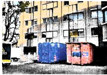
Afgezien van een paar containers op de parkeerplaats was van de verbouwing weinig te merken

Rijk zegt niet meteen "ja" tegen elk voorstel. De landelijke opvang van straks meer dan 100.000 Oekraïners is een peerdure operatie, dus er wordt goed gekeken naar de begroting. De locatie aan 5.1.2.e terlottelaan is tot op zekere hoogte comfortabel, maar het zijn zeker geen appartementen waar iedereen wil wonen' (zie 'Die opvang is tot op zekere hoogte comfortabel, maar niet super de luxe' op pagina 28).