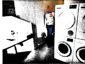
5.1.2.e : alles nieuw

was dat oplevering uiterlijk in november mogelijk moest zijn.