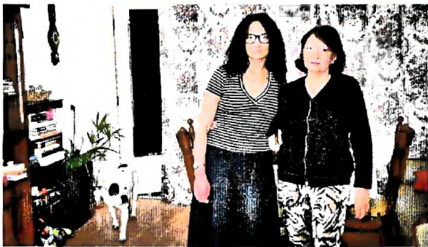
5.1.2.e en haar moeder, die bij haar inwoonde na haar vlucht uit Oekraïne. Moeder is inmiddels verhuisd naar een kamer in de opvang aan de Meesterlottelaan

Rijk zegt niet meteen "ja" tegen elk voorstel. De landelijke opvang van straks meer dan 100.000 Oekraïners is een peerdure operatie, dus er wordt goed gekeken naar de begroting. De locatie aan 5.1.2.e terlottelaan is tot op zekere hoogte comfortabel, maar het zijn zeker geen appartementen waar iedereen wil wonen' (zie 'Die opvang is tot op zekere hoogte comfortabel, maar niet super de luxe' op pagina 28).